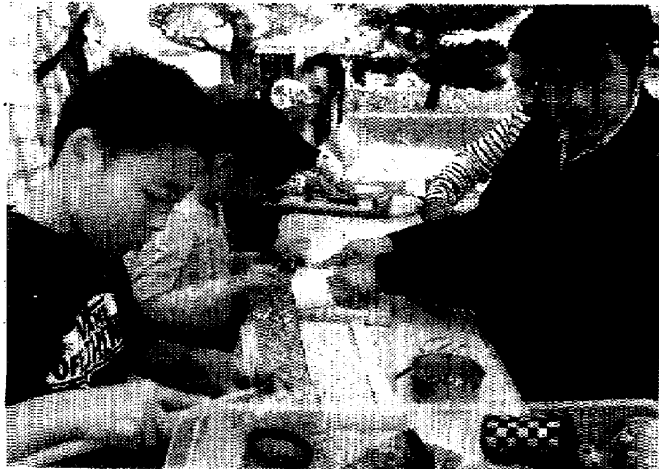
畳の素材でものづくりをする参加者ら