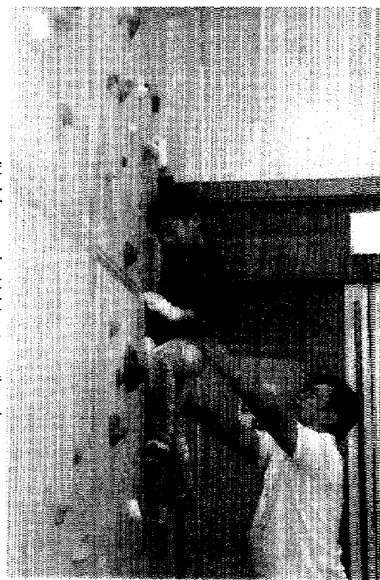
ボルダリング体験をする参加者

また、ボルダリングウォール作りやダンボール迷路など、駅東駅前広場ではミニ黒板作りや丸太を切つてのコースター作り、畳屋さんのワークショップなども行われた。さらには、来場したキッチンカーによりグルメも満喫するなど、会場は終日にぎわっていた。